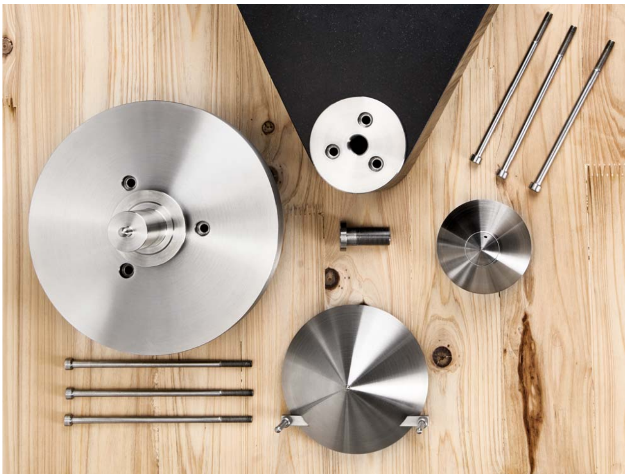
K dotvoření modelu G6+ je zapotřebí několik zásadních součástí, mezi které patří nerezová základna s ložiskem (vlevo nahoře) či hlavní hrot (uprostřed dole).